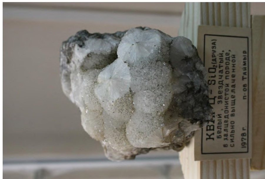
Фото 9. Кварц звёздчатый