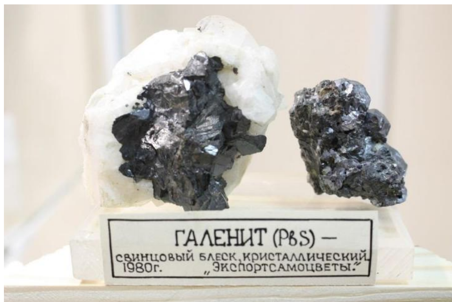
Фото 7. Галенит