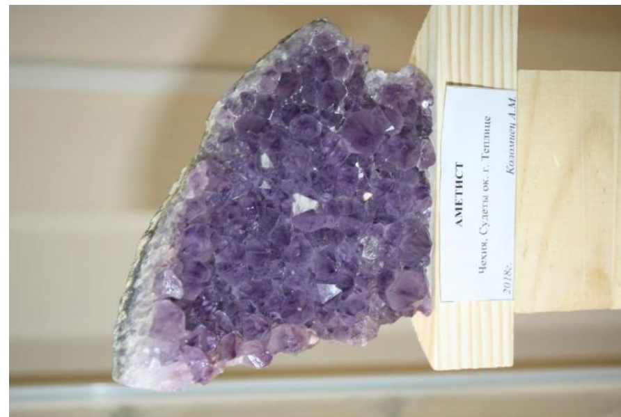
Фото 13. Друза аметиста