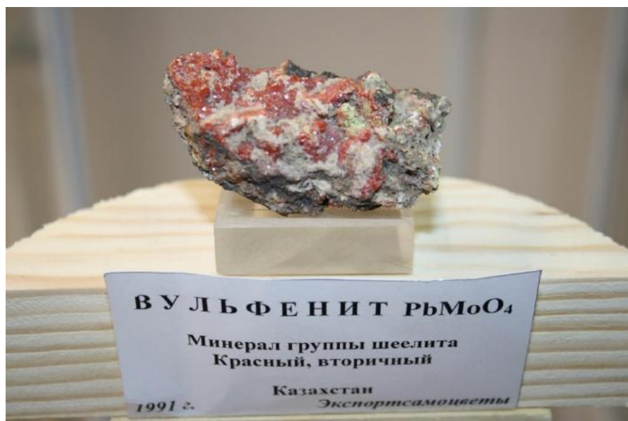
Фото 12. Вульфенит PbMoO_4