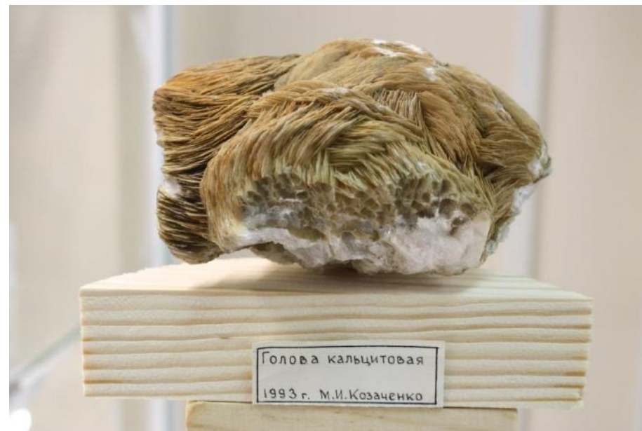
Фото 5. Кальцитовая голова