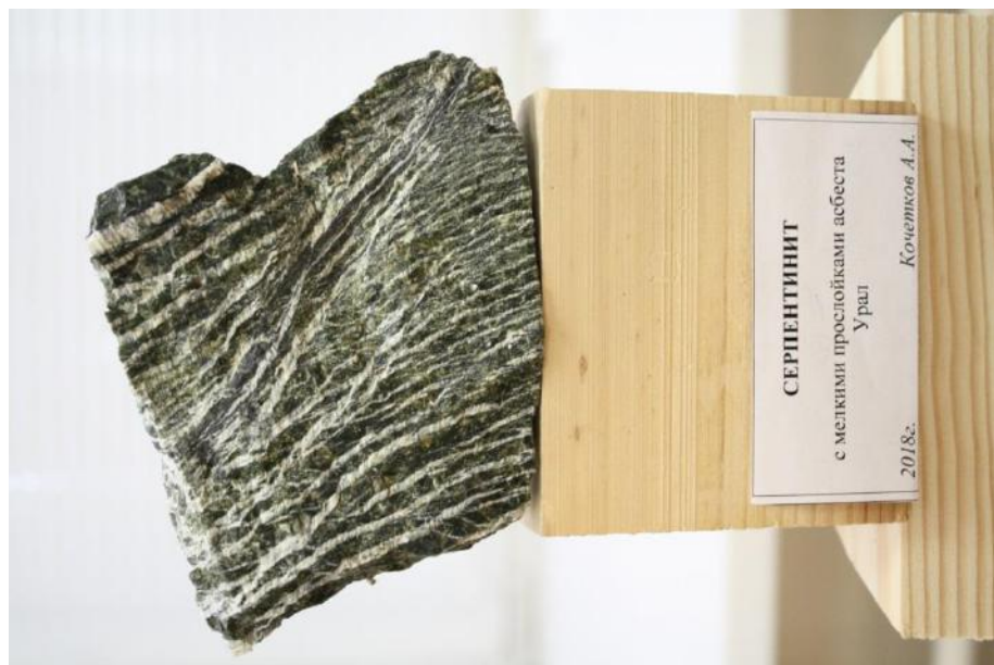
Фото 19. Серпентинит