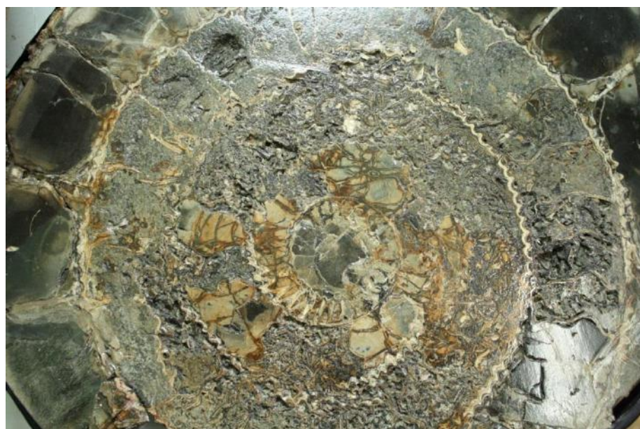
Фото 20. Аммонит в разрезе