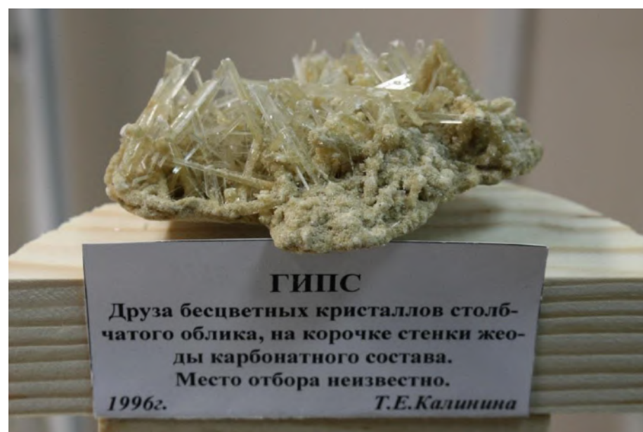
Фото 6. Друза гипса