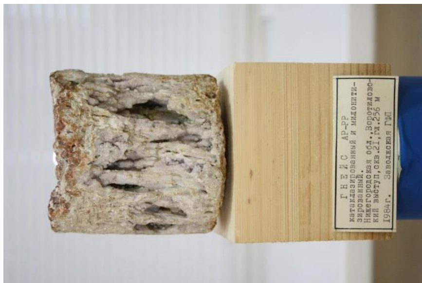
Фото 23. Гнейс