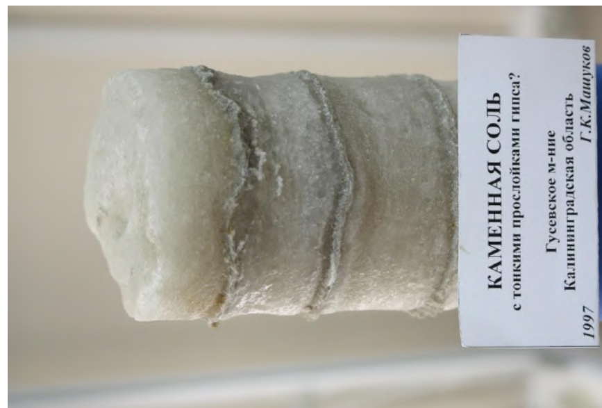
Фото 1. Каменная соль