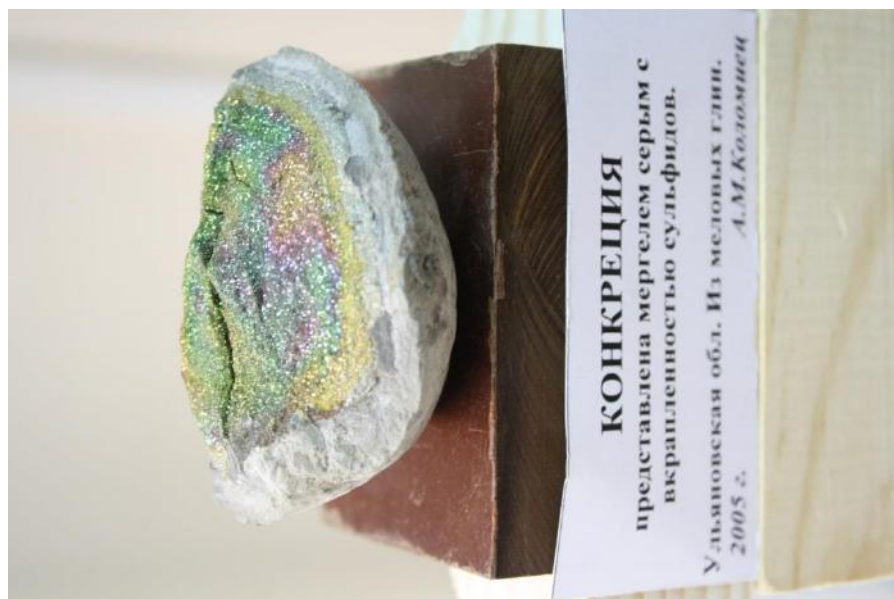
Фото 11. Конкреция с марказитом