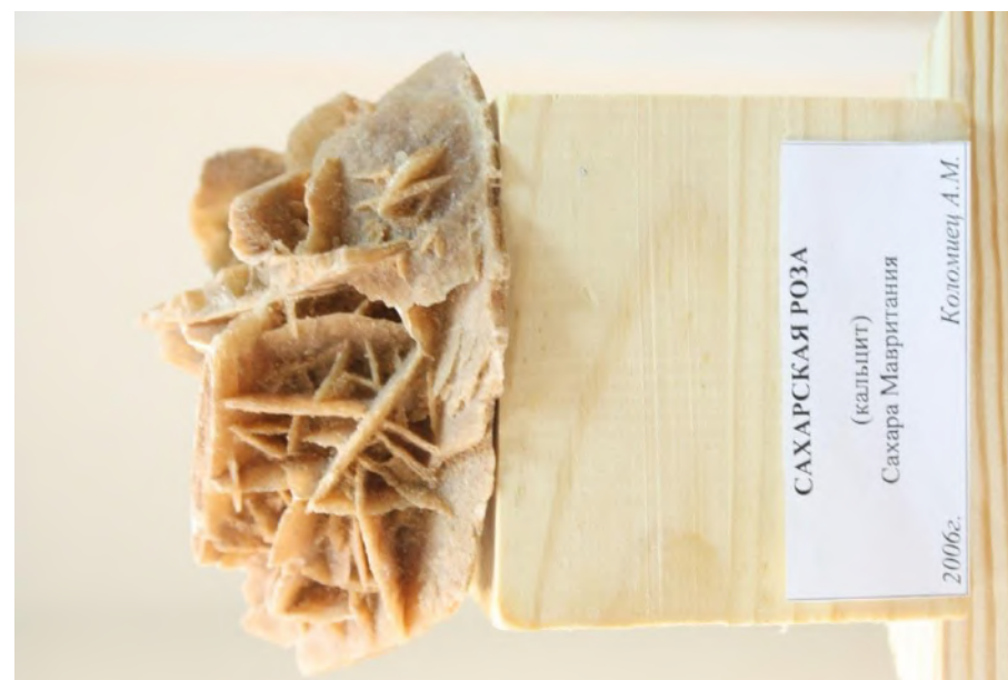
Фото 2. Сахарская роза