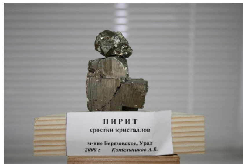
Фото 18. Пирит