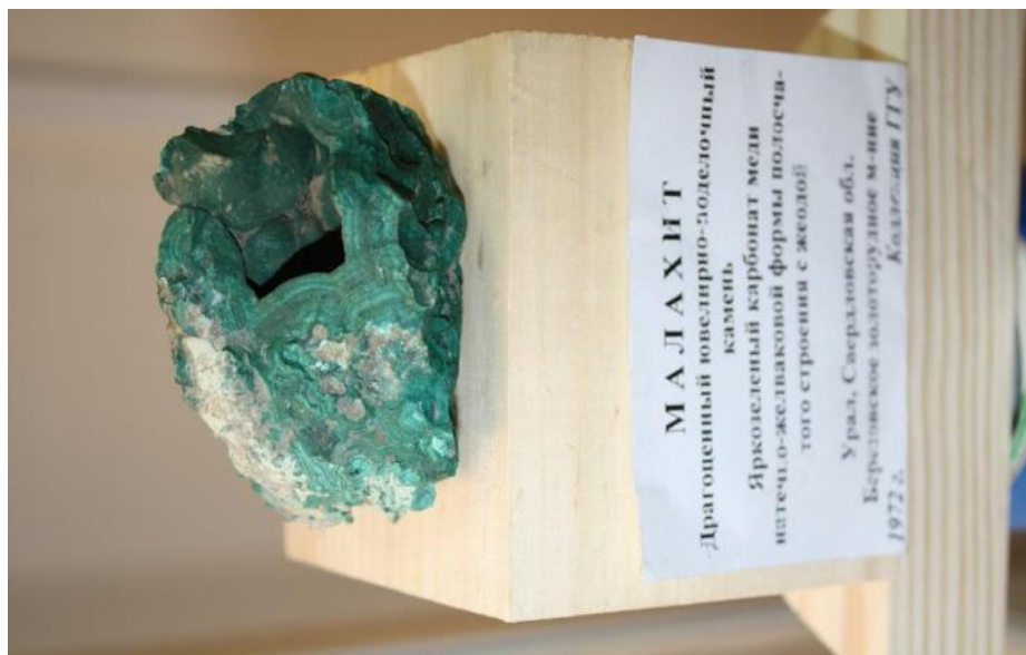
Фото 16. Малахит