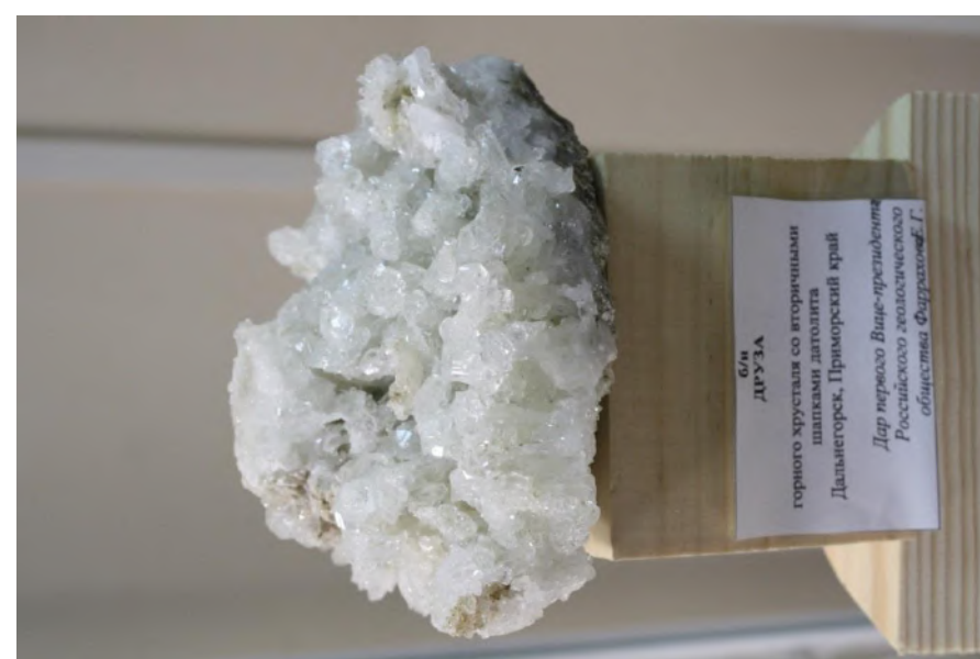
Фото 14. Друза горного хрусталя с датолитом