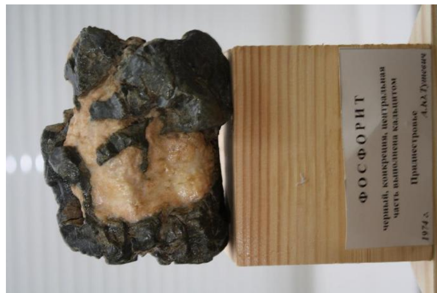
Фото 21. Фосфорит