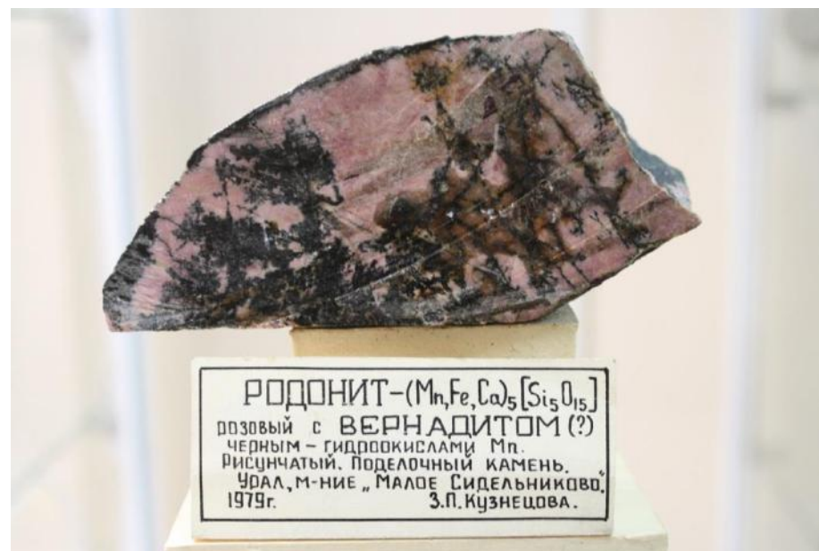
Фото 17. Родонит (яшма)