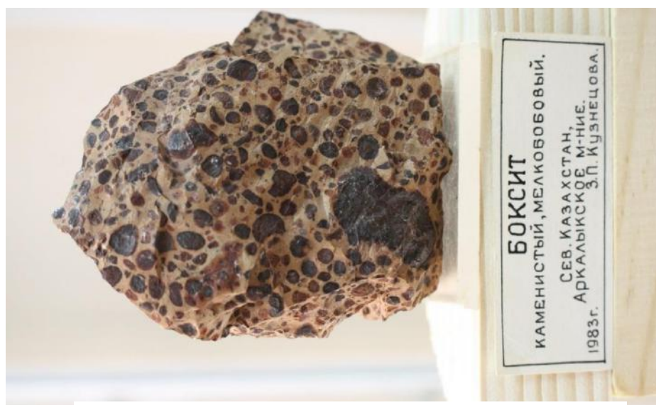
Фото 8. Боксит