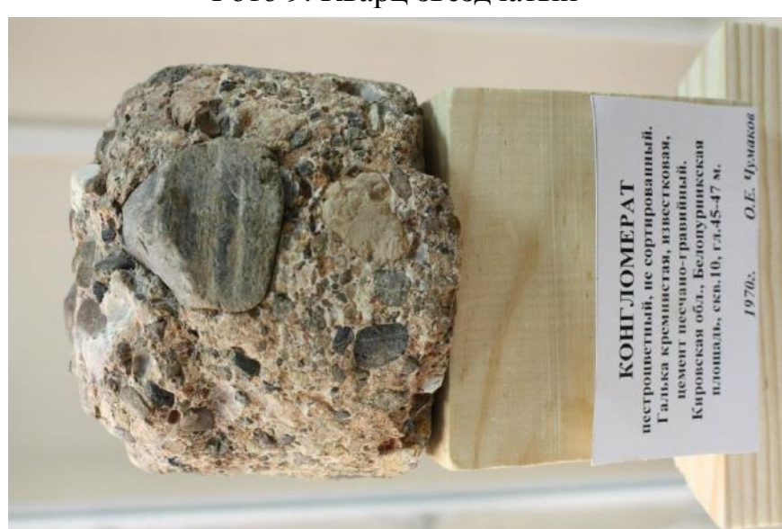
Фото 10. Конгломерат