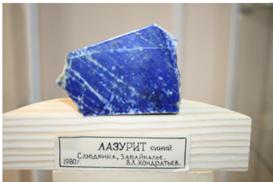
Фото 24. Лазурит