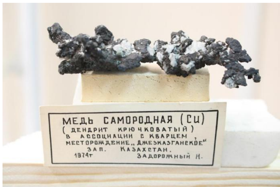
Фото 3. Самородная медь