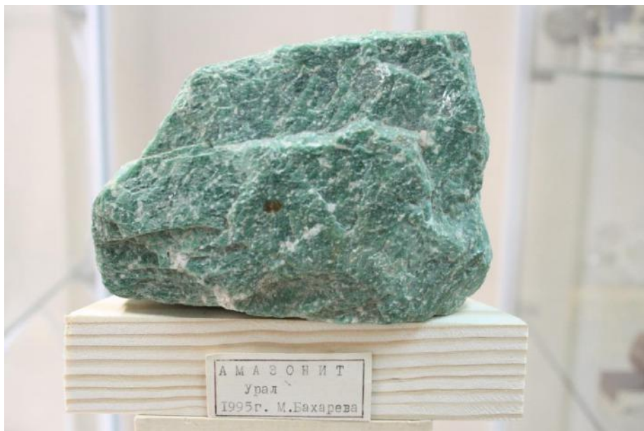
Фото 15. Амазонит