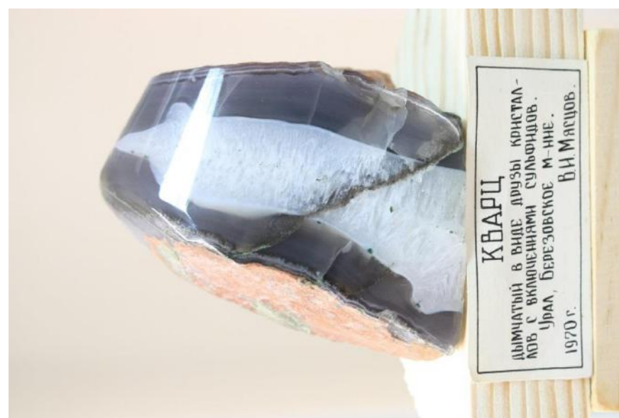
Фото 22. Кварц