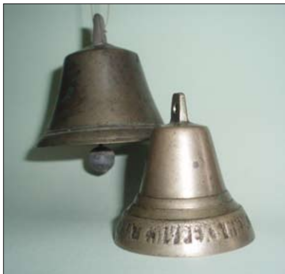
Пурехские колокольчики. Завод П. Г. Чернигина. Конец XIX — начало XX века. Надпись по низу: ПУРЕХЪ НИЖ. ГУБ. ЗАВ. ПАВ. ГРИГ. ЧЕРНИГИНА

В ОКРУГЕ БЫЛО МНОГО ДЕШЕВОГО ПО ТЕМ ВРЕМЕНАМ ЛЕСА, ПОЭТОМУ В СЕЛЕ РАЗВИВАЛИСЬ ЛОЖКАРНОЕ, ВЕРЕТЕННОЕ, ГРЕБНОЕ, СТОЛЯРНОЕ РЕМЕСЛА. ЗДЕШНИЕ МАСТЕРА-ЛОЖКАРИ СЛАВИЛИСЬ НА ВСЮ РОССИЮ. <...> В СЕРЕДИНЕ XIX ВЕКА ИЗ ВАЛДАЯ В ПУРЕХ ПРИШЕЛ НОВЫЙ ПРОМЫСЕЛ — ЛИТЬЕ КОЛОКОЛЬЧИКОВ. ПУРЕШАНЕ ТАК ХОРОШО ИМ ОВЛАДЕЛИ, ЧТО ВСКОРЕ ЗАТМИЛИ ВАЛДАЙЦЕВ.