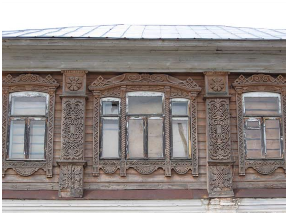
Резьба на фасаде и каменные ворота старинного дома