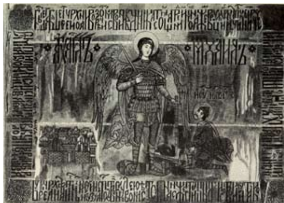
Знамя князя Дмитрия Пожарского. Иллюстрация из книги: Сказание Авраамия Палицына. М.-Л., 1955