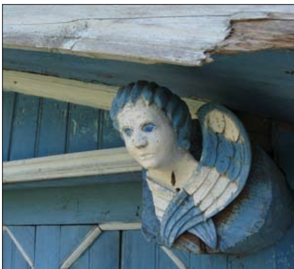
Головка ангела на въездных воротах

На соседней улице залюбовались другим деревянным домом. На фасаде ярко выделяются новые, выкрашенные в белый цвет наличники с искусной резьбой, такой же белый резной карниз и разные мелкие ажурные детали. Под коньком красуется двуглавый орел. И даже название улицы и номер дома акку-