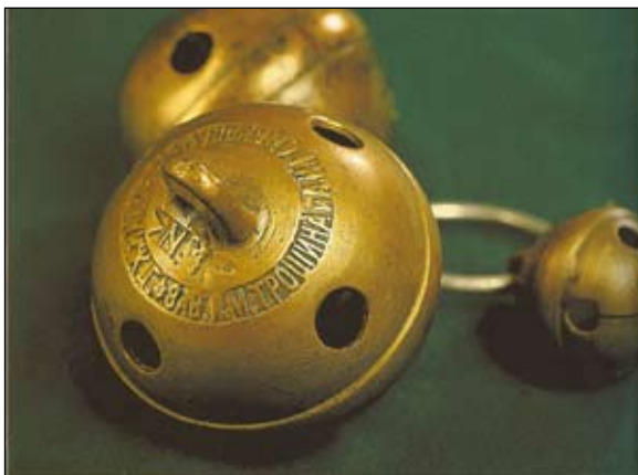
Бубенчики для украшения конской сбруи. Из книги: Федоров В. В. Павловские замки. Пурехские колокольчики. Н. Новгород, 2009