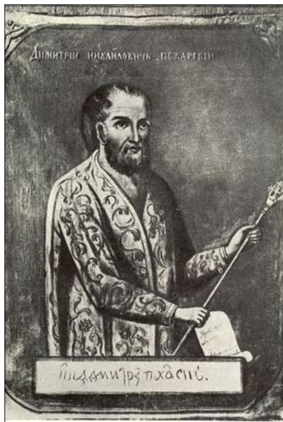
Князь Дмитрий Пожарский.

За победу народного ополчения 1611–1612 годов князь Д. М. Пожарский получил обширные земли в Белгородье (некоторые исследователи, впрочем, называют другую дату — 1610 год). «По освобождении Москвы <...> от полчищ польских [он] лечился от ран в Пурехе, перешедшем после в наследственное владение его потомства». На нижегородских землях князь возвел несколько церквей, в том числе церковь в честь Казанской иконы Божией матери, сопровождавшей ополчение в походе на Москву. В 1622–1625 годах на слиянии двух рек — Каменки и Колесенки, ниже впадающей в реку Юг — рядом с селом Крапивиным в Петряевской пустоши на свои личные средства он основал Спасо-Макарьевский монастырь для ополченцев, получивших тяжкие увечья. Кто мог держать в руках инструмент, принимал участие в строительстве деревянного шатрового Спасо-Преображенского храма с двумя приделами — в честь преподобных Макария Желтоводского и Евфимия Суздальского. Поставили братские кельи, пекарню, амбары, скотный и конюшенный дворы. Территорию обнесли высокой оградой с резными воротами. Рядом образовалось поселение Макарьевская полуслободка, где жили обслуживающие обитель люди — мастеровые, а также крестьяне, обрабатывающие пахотные земли.