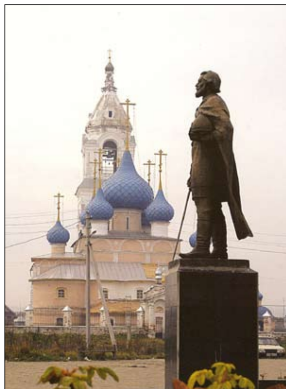
Памятник князю Д. М. Пожарскому. Иллюстрация из книги: Подвиг во имя России. Нижний Новгород, 2005