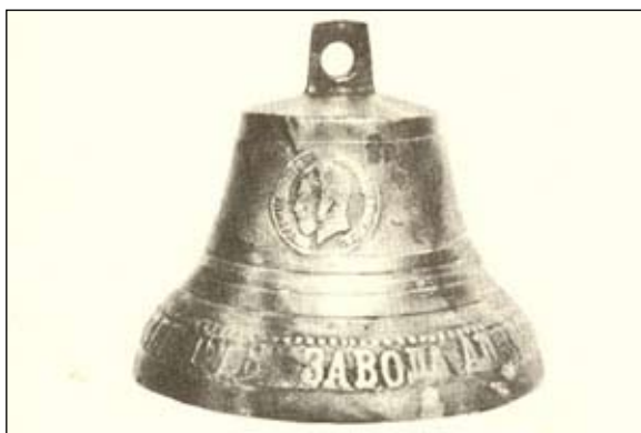
Пурехский колокольчик с изображением медали, полученной на Всероссийской выставке 1896 года в Нижнем Новгороде, отлитый на заводе А. М. Трошина. Иллюстрация из журнала «Памятники Отечества». № 2. 1985

В середине XIX века из Валдая в Пурех пришел новый промысел — литье колокольчиков. Пурешане так хорошо им овладели, что вскоре затмили валдайцев. В 1896 году пурехские колокольчики получили серебряную медаль на XVI Всероссийской про-