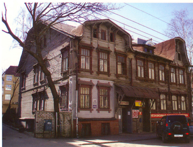
ул. Маслякова, 14

Уходящие из нашего столетия старинные постройки хранят множество тайн. Это и истории человеческих судеб