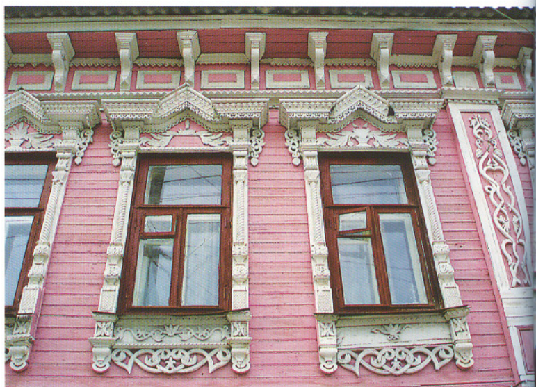
ул. Малая Ямская

Итак, наш путь лежит по улице Малая Ямская. Перед нами двухэтажный дом № 1. Он действительно очень красив: главный и боковые фасады украшают искусно выполненные в технике пропиленной резьбы наличники, карниз, ажурные пилястры. И вновь мы видим растительный орнамент. Окраска главного фасада здания дает возможность сохранить жизнь деревянным деталям, выделить их разными цветами и тем самым сделать привлекательнее.