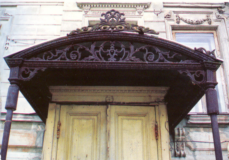
пер. Казбекский, 4

Еще одно здание на Ярославской – добротный бревенчатый жилой дом (№ 7) – привлекает внимание наличниками с лаконичной накладной резьбой и с удивительным солярным знаком, украшающим верх чердачного окна. Соляр-