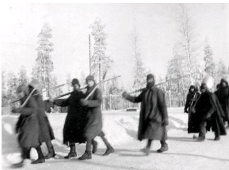
Могильщики в фильтрационном лагере Наараярви