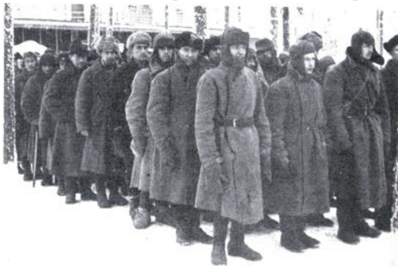
Советские военнопленные во время войны между Финляндией и Советским Союзом в 1941-1944 годах

Долгое время проблема финского плена в годы Второй мировой войны оставалась малоизученной. Это было связано, прежде всего, с закрытостью архивных фондов. Не способствовало активизации объективных исследований и то обстоятельство, что определённые политические силы в Финляндии вопрос о военнопленных намеренно замалчивали, стремясь скрыть от последующих поколений преступные деяния периода войны.