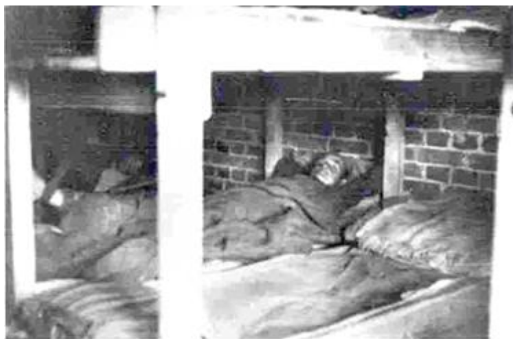
Советский военнопленный на нарах в лагере в 1942 году.

Весьма болезненной по политическим мотивам для финской историографии и малоразработанной по причине нехватки источников для российской историографии являлась проблема массовой смертности среди военнопленных в концлагерях Финляндии. Долгое время она оставалась «белой страницей» истории Второй мировой войны. Важные шаги по преодолению сложившейся ситуации были предприняты финской стороной в конце минувшего столетия. В 1987 году финский писатель и исследователь Эйно Пиэтола опубликовал заслуживающий внимания документальный труд «Военнопленные в Финляндии 1941-1944» (русский перевод был опубликован петрозаводским журналом «Север» 1990. № 12. Режим доступа в Интернете: http://www.aroundspb.ru/finnish/pietola/pietola1.php ). В этом исследовании Пиэтола на конкретных примерах показывает, как обращались с военнопленными в финских лагерях, анализирует причины их высокой смертности.