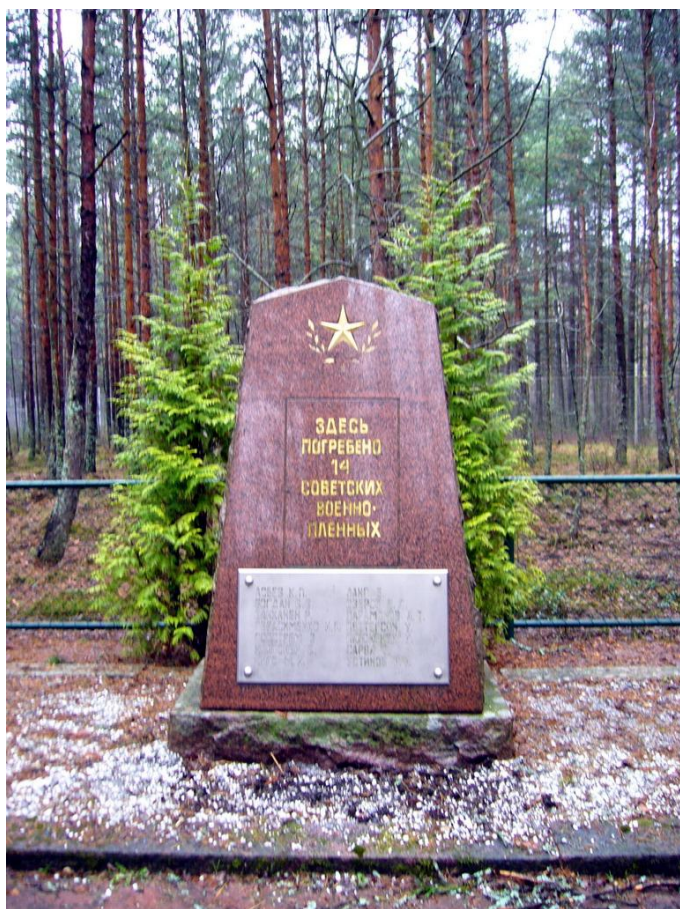
Захоронение в Кярсямяки (пригороде Турку)

ные в Финляндии 1941-1944. Режим доступа: http://www.aroundspb.ru/finnish/pietola/pietola6.php ).