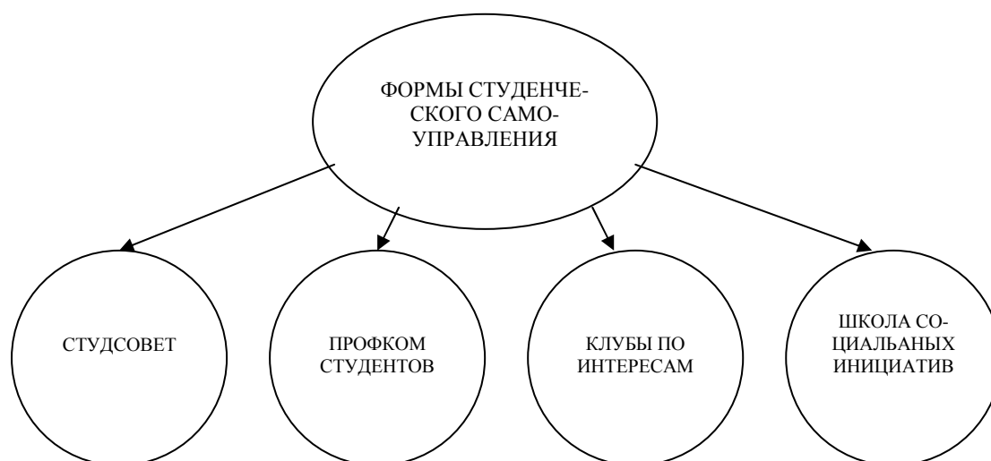
Рис. 1. Формы студенческого самоуправления

– изучение нужд и запросов студентов, информирование руководства университета о результатах исполнения;