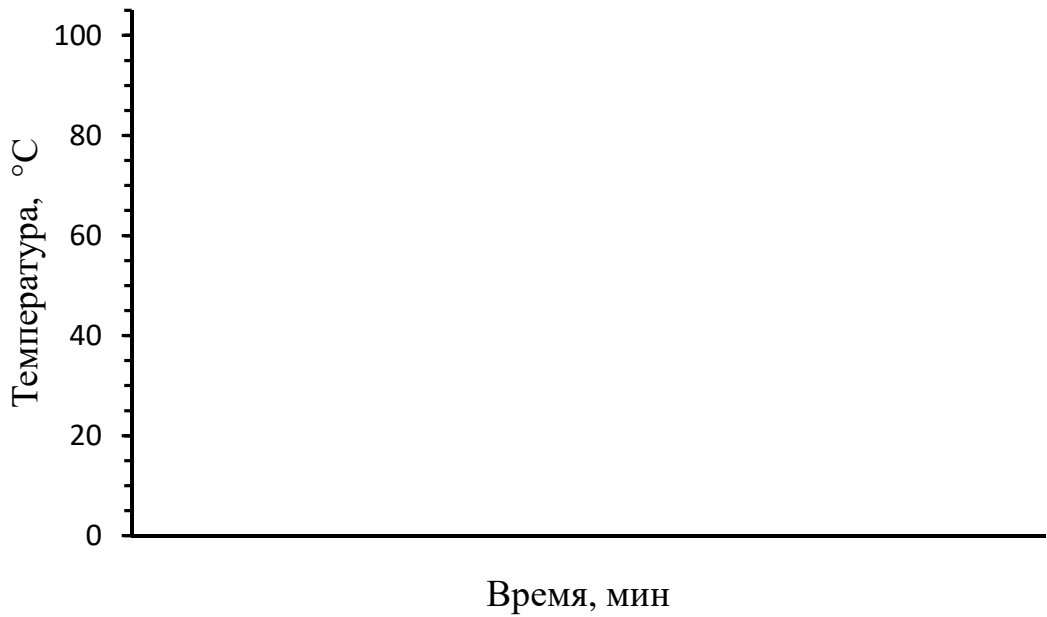
Рисунок 2.1 – График гашения извести

Время начала снижения максимальной температуры